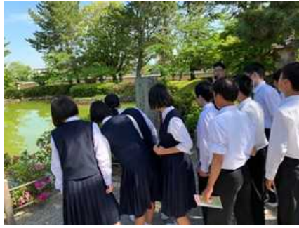
(鏡池の傍にある句碑: 柿くへば鐘が鳴るなり法隆寺)