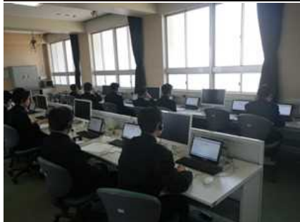
(英語:話すことの調査の様子)