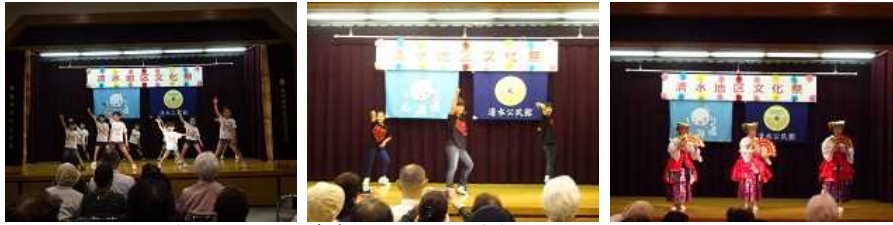
芸能発表の様子です。キッズダンスや伊予万歳も行われていました。