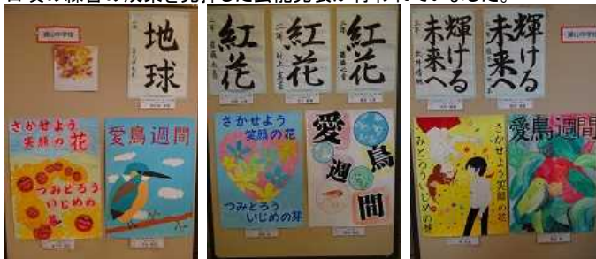
勝山中学校の生徒作品です。

すばらしい秋空の下、清水公民館で第44回清水地区文化祭が行われ、 たくさんの地域の方々が交流を図っていました。 小・中学校の生徒作品や地域の方々のすばらしい作品、習字や絵はがき、 こども生け花などが展示されていました。 また、玄関ロビーでは余剰品販売やバザーが、二階の集会室では、 日頃の練習の成果を発揮した芸能発表が行われていました。