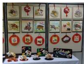
地域の方々の作品です。