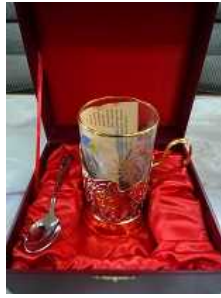
ロシアは紅茶文化だそうです。