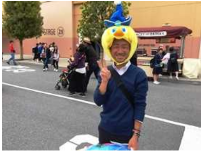
久しぶりに太陽の光の下で楽しんでいます。(^_^)/