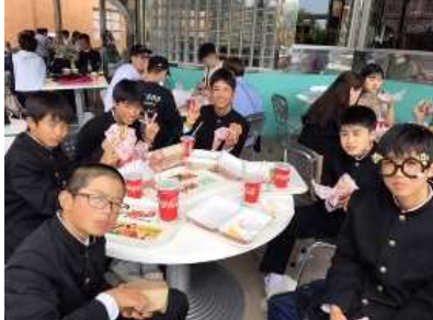
USJに到着しました。この後15:00までUSJを楽しみます。