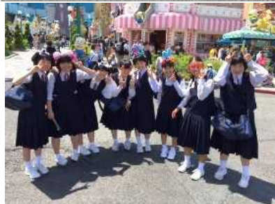
曇り空で暑くもなく過ごしやすい中、しかも空いていてスムーズに乗れています。