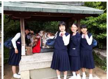
「北野天満宮」は菅原道真を祀った神社です。菅原道真は学問の神様としても知られており今でも、受験生などの祈願や絵馬の奉納が後を絶ちません。勝中生も目標達成に向けて、タクシー研修で合格祈願に北野天満宮を訪れる班が多くみられます。また、天満宮には撫で牛信仰というものがあります。牛の頭をなでて、自分の頭をなでると頭がよくなると言われています。さっそく…