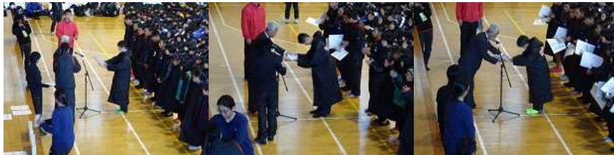
男子 1区 区間賞表彰