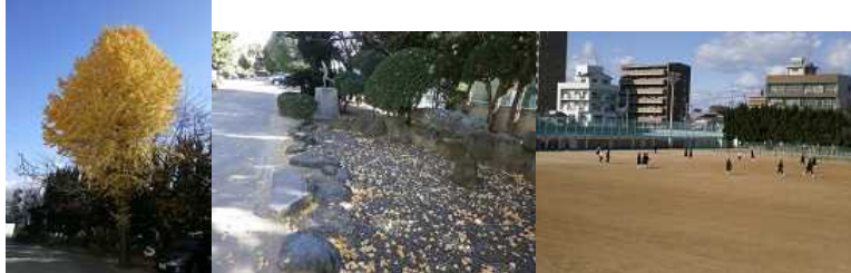
いくら掃除をしても...