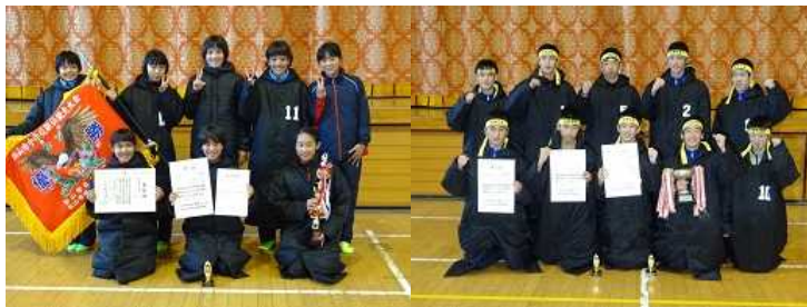
女子 6区 区間賞表彰(大会新記録)