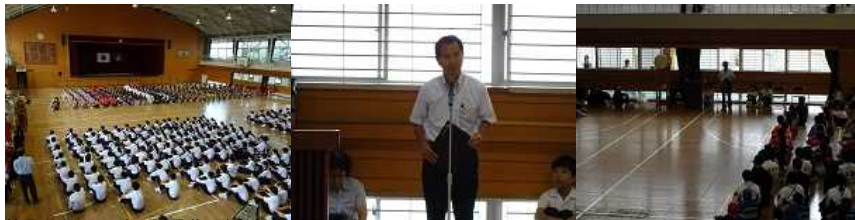
校長先生からの激励の言葉です。