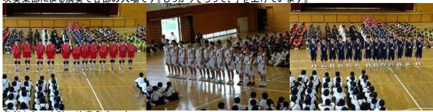
各部からの力強い決意発表です。