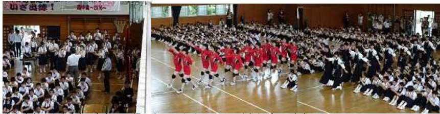
吹奏楽部による演奏で各部の入場です。しっかりそろって、手を上げています。