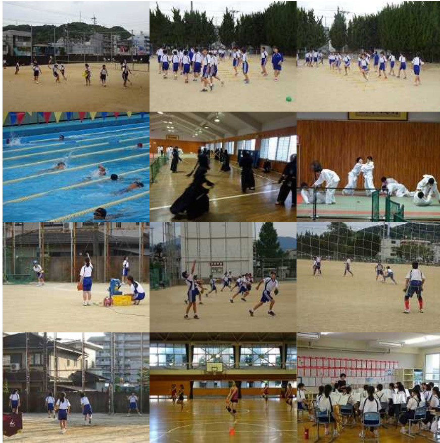
いけいけ勝山 押せ押せ勝山 勝中 勝中 ファイト オー