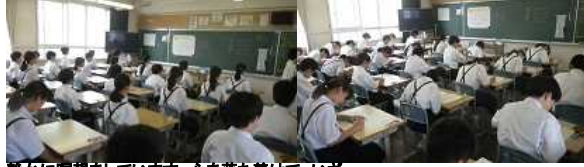
静かに瞑想をしています。心を落ち着けて、いざ...

昨日より期末テストが始まりました。 1年生は初めての期末テストに落ち着いて取り組んでいます。 各学年、休憩時間にもしっかり勉強に取り組んでいます。 今日も午後から帰宅します。家庭でも全力で復習に取り組んでほしいと思います。