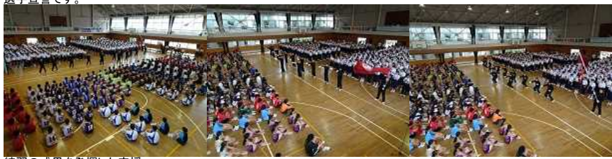
練習の成果を発揮した応援。