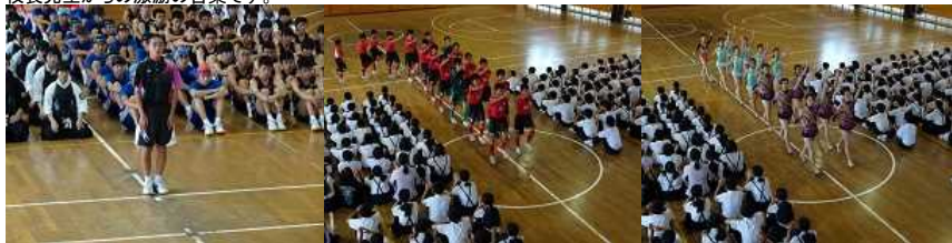
お礼の言葉の後、選手が退場しました。