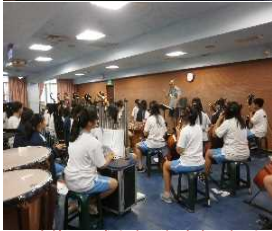
DVDを使って勝山中の紹介をしました。