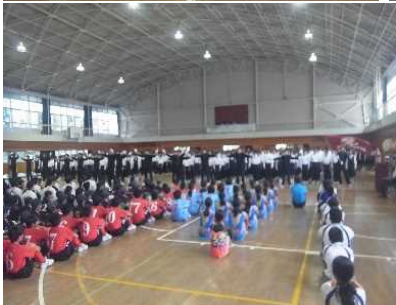
さわやか体育大会がんばってください！