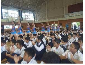
どの部も気持ちが入った行進です