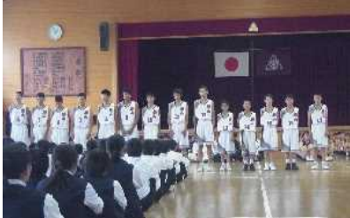
全員入場しました