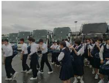
必要な荷物だけ持って降車