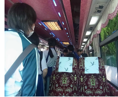
綺麗で清潔なバスの室内