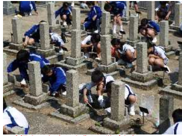
清掃中:1年生は先輩から学びます