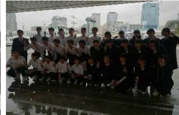
メリケン波止場でポーズ！