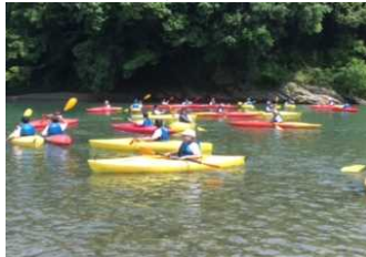
「水が冷たくて気持ちいい〜！」 「水泳部に入ったら泳げるようになるってO中先生が言ったよ〜」