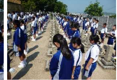
全員で黙禱します