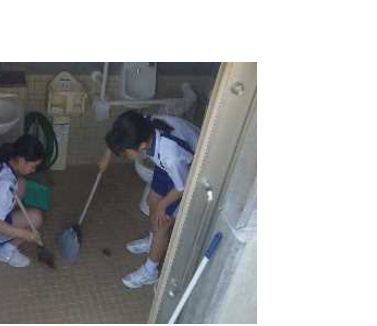
トイレもきれいになりました