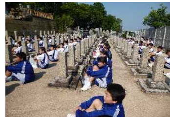
途中で合流したり、現地に直接来たりして 総勢135名が集結しました。