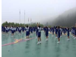
あさもやがかかっています。

おはようございます。全員元気で2日目の朝を迎えました。大洲は盆地なので、朝は涼しいそうです。目を覚ますために体を動かし、しっかりと朝食をとりました。天気にも恵まれ、楽しみにしていたカヌーやスポーツ活動もできそうです。