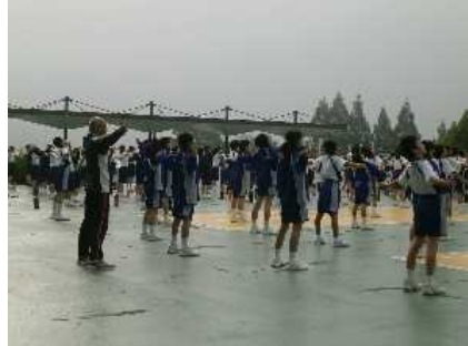
ラジオ体操で体を起こします

2016年5月21日(土曜日) 大洲 カヌー&スポーツ活動2 タベの集い カテゴリ: