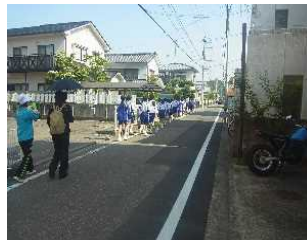
上級生が先頭で移動します。