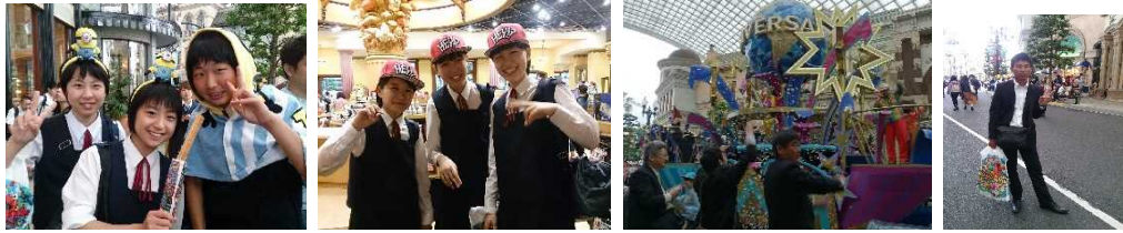
先生たちも楽しんでいます。お土産も買いました。