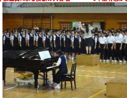
迫力！！これが3年生の実力！