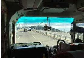
明石海峡大橋を渡り淡路島へ

道路に渋滞がありません。 快適なドライブです。予定より早く淡路SAに着きました。 バスの中でお弁当をいただきます。