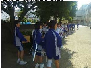
午前8時40分北門に約60人が集合しました。

今日は平成28年度で初めてのロシア兵基地清掃奉仕活動に行ってきました。朝から快晴、午前9時から約1時間、力を合わせて清掃しました。