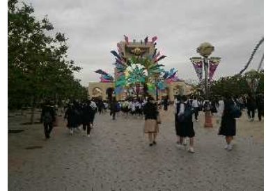
高まる気持ちを抑えつつゲートに向かいます