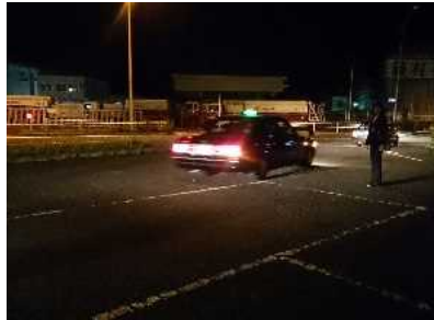
テールランプが少し寂しい？

雨もよく降りました。だからこそ、工夫して行動すること、我慢すること、協力することの大切さ、つまり「楽・楽・学・創」の精神を実践できたとも捉えることができます。そして、何よりも仲間と過ごした三日間は、深く心に残る思い出となりました。保護者の皆様、ご理解とご協力をありがとうございました。お家で温かくお迎えいただき、たくさんの思い出話を聞いてあげてください。