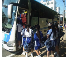
バスに乗り込みます(^)/