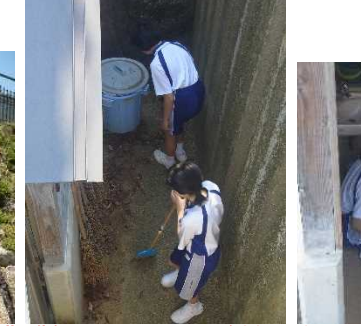
たくさんの落ち葉も