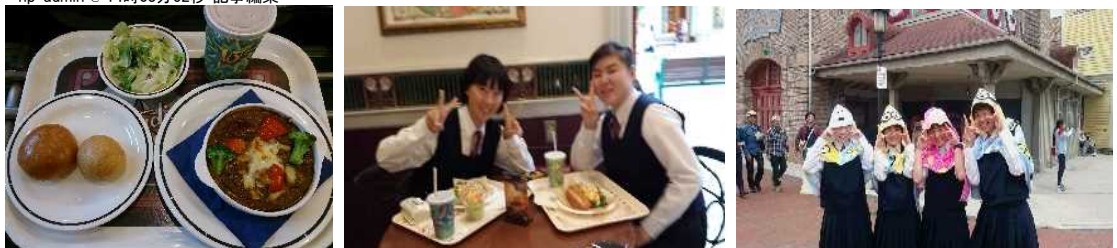
ランチはこんな感じです