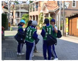
「ここ、どこ?」「う〜ん?大洲かな?」

- hp-admin @ 18時22分22秒 記事編集 活動の様子です。みんな頑張っています。