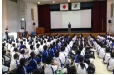
集団宿泊活動を成功させようと、みんな頑張っています。