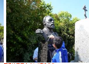
銅像は専用オイルで磨きます