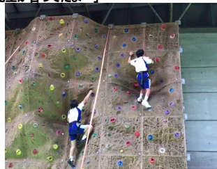
「嵐になった気分だよ〜」