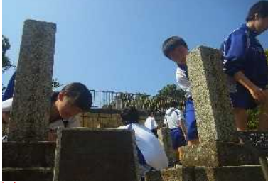
それぞれが持参したスポンジやたわし、布を使って墓石をしっかりと磨きます