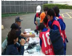
クイズの答えとタイムを申告中