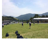
フライングディスクゴルフ