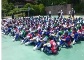
みんな真面目に聞いています。

最初の活動『ウォークラリー』が始まります。大自然の中、大洲の美味しい空気を胸一杯に吸い込み、良い思い出ができることを期待します。