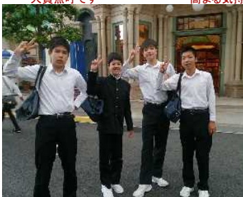
ポップコーンを食べるか悩んでいます