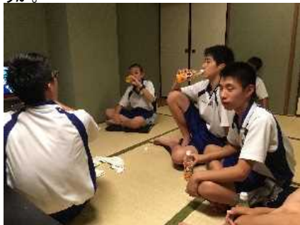
風呂上がりのジュース。おいしいです！

昨夜の様子をお知らせします。旅館二日目、 京都の最後の夜 です。入浴後に差し入れの ジュース をいただき、 班会議 。最終日の USJ で十分に楽しめるようしっかり睡眠をとります。「あと一日か。少し居たいなあ。」と寂しさが芽生える頃でしょうか。