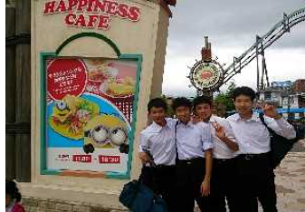
楽しんでいますよ