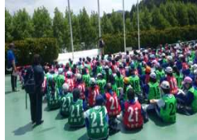
さすが勝中生です。聞く姿勢が素晴らしいです。