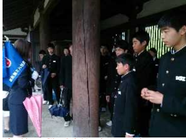
ガイドさんの説明を真剣に聴いています。

奈良の法隆寺に到着です。少しずつ雨足が強くなってきました。お昼ご飯を食べた後は、みんな 元気いっぱい です！有名な法隆寺を見学し、日本の歴史や木造建築の奥深さに感動しています！