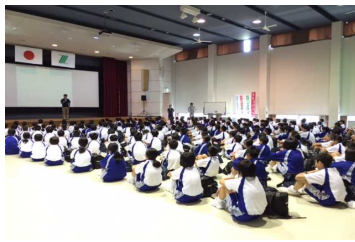
所員さんの説明を一生懸命聞いています。

無事、国立大洲青少年交流の家に到着しました。今から入所式を行い、施設の説明を受け、集団宿泊活動を開始します。