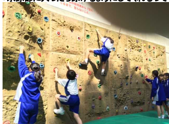
「クライミング・ウォールって、おもしろいね〜」