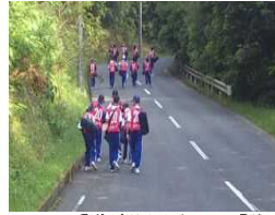
「道が分からない?」「前について行こう!」