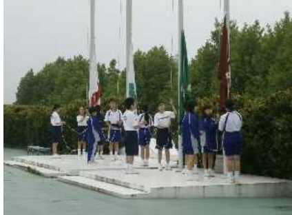
他の団体とともに国旗、所旗、校旗の掲揚です

最終日の朝も霧に包まれた交流の家。五月晴れの一日が予想できます。朝の集いの様子です。