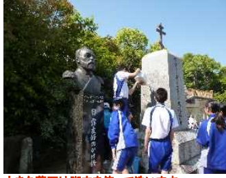
大きな墓石は脚立を使って洗います