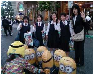
本当に楽しい一日でした