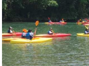
「私、泳ぎが苦手なんですけど…」