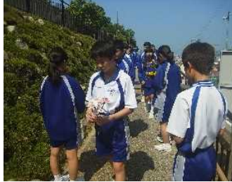
お花とお線香が配られ