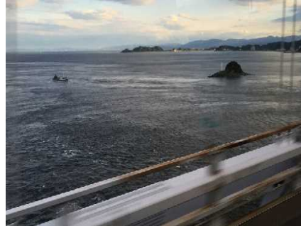
車窓から見る鳴門海峡。激しい流れです。