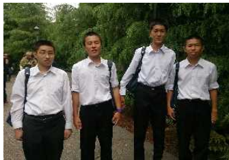
さわやかなスイガイ