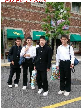
ここでもお土産買いました