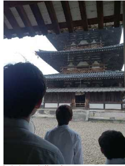
有名な五重塔です。