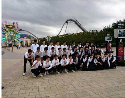
学級で集合写真です