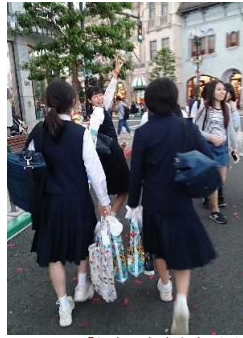
「好きです勝中会」からいただいたジュースを持って乗車します