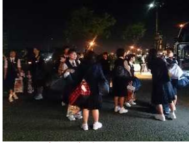
バスから降りました