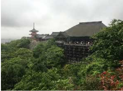
有名な舞台が雨でぬれていても、とても楽しい研修です。