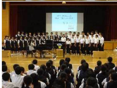
すてきなBGMが流れる中、入場です