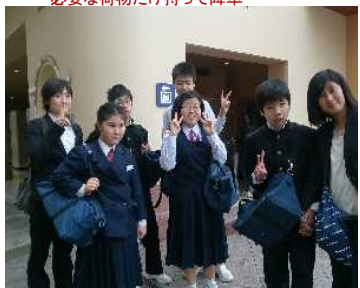
何に乗るか相談しています