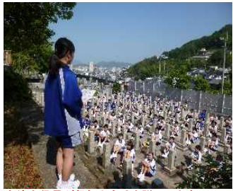
生徒会役員が趣旨と方法を説明します