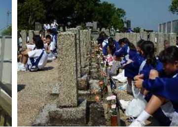
お供えできました