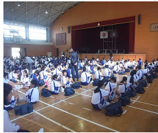
結団式後の健康観察の様子