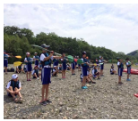
「パドリングっておもしろいね」 「カヌーの華」