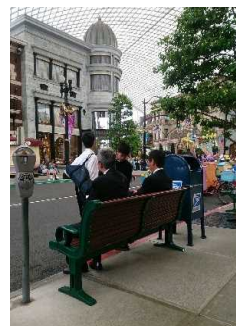
お目当てのアトラクション目指し、歩く！歩く！